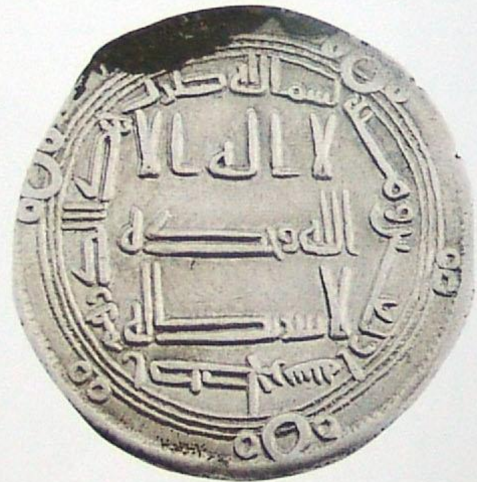
درهم عباسي المنصور ضرب: اصطخر سنة: ١٤٠ هجري Abbasids Dirham Al-Mansour struck at Estakhre Year: 140 H